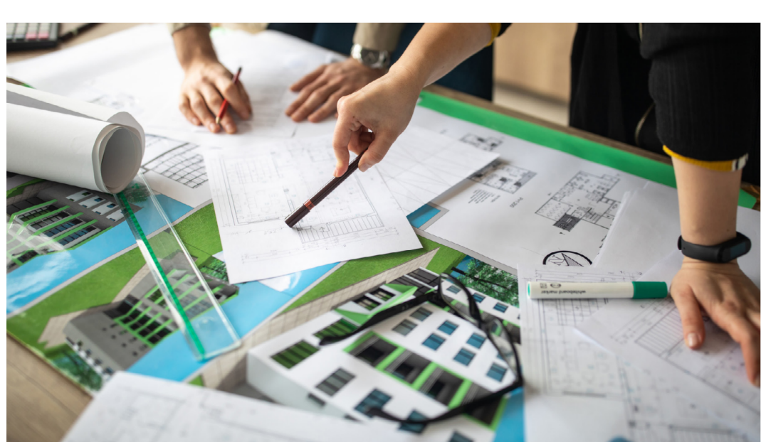
라이프스타일에 맞춘 1:1 상담