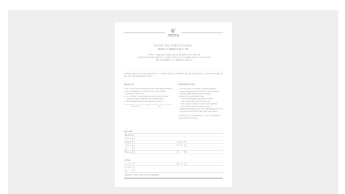
믿을 수 있는 12년 품질보증