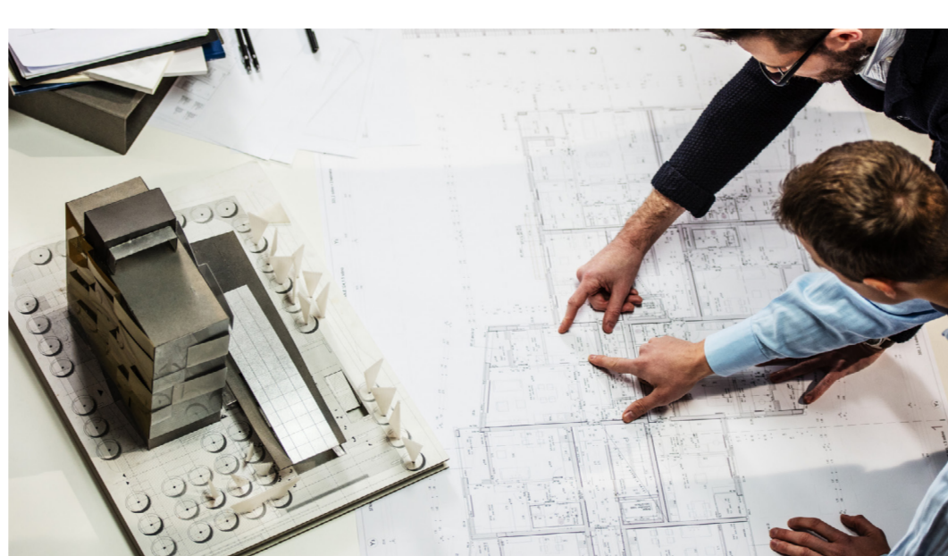
개별 공간에 따른 큐레이션 서비스