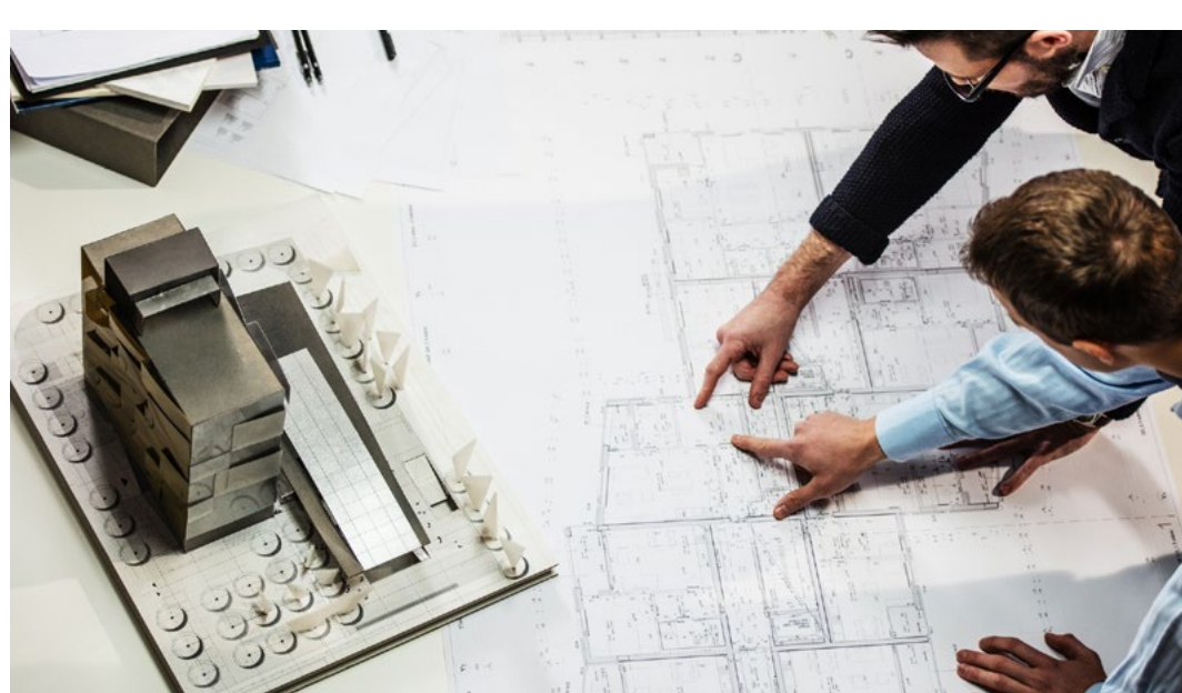
개별 공간에 따른 큐레이션 서비스