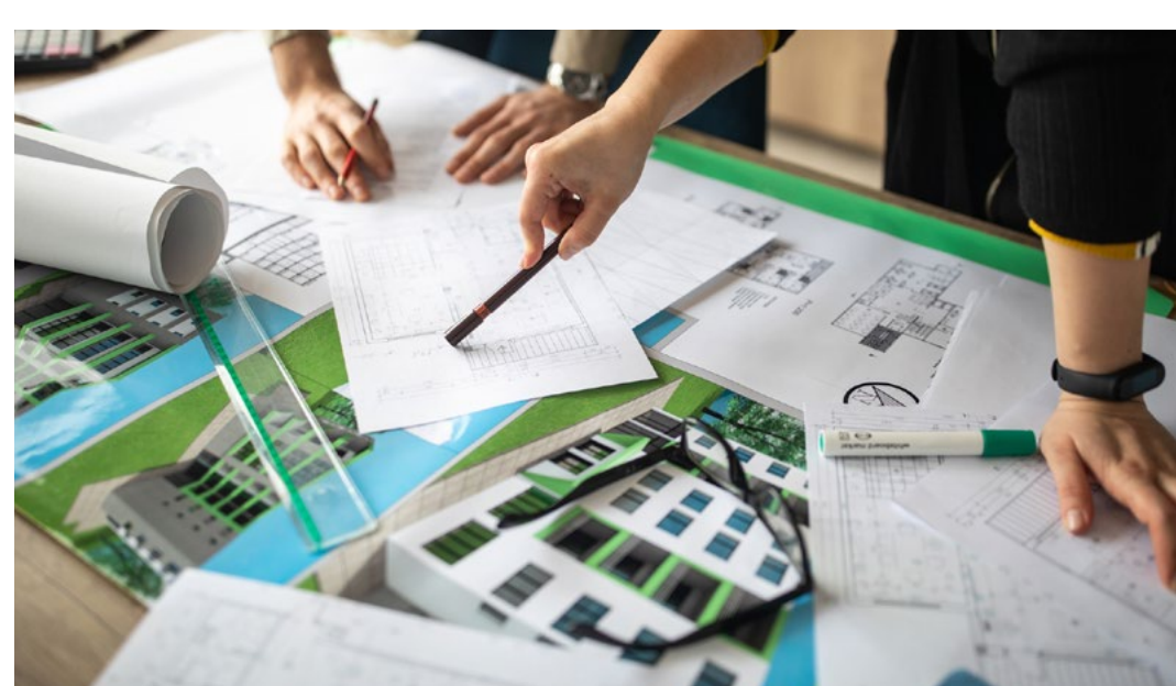
라이프스타일에 맞춘 1:1 상담