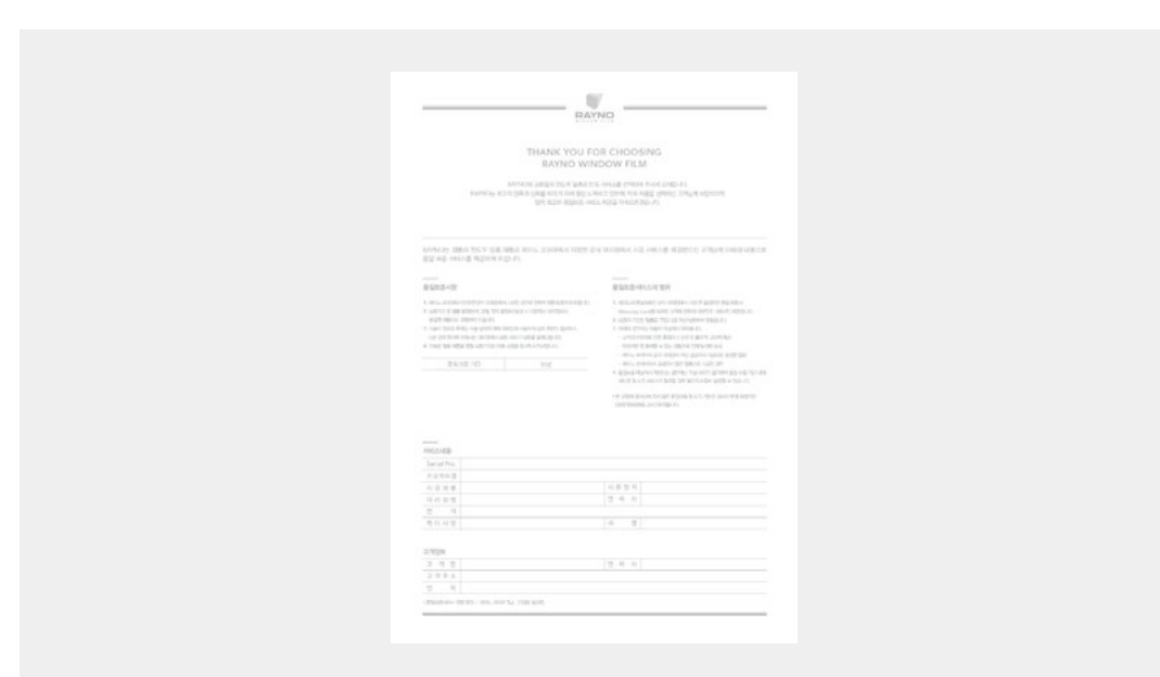
반영구적 최대 30년 품질보증